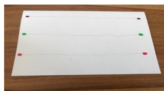
Support demi-feuille A4 orientation paysage