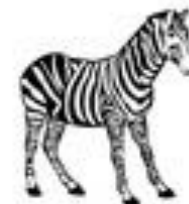
#19647728 Z ébre